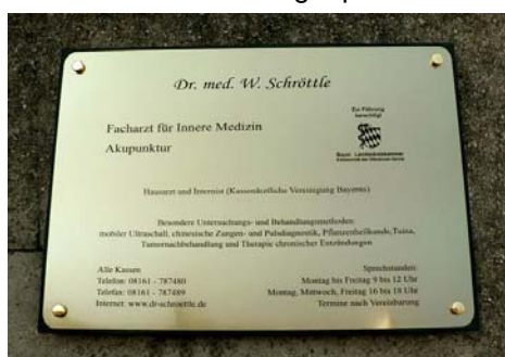
Praxisschild in Messing-Optik