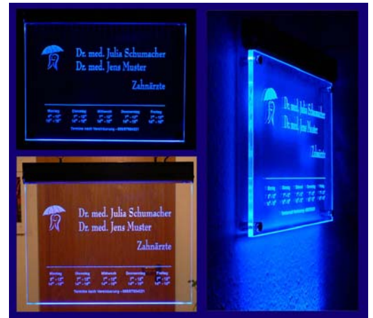
Praxisschild / Apothekenschild beleuchtet