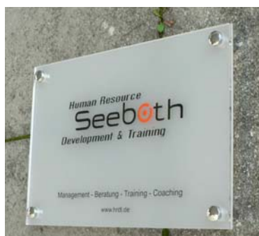
Firmenschild in Milch-Optik